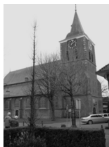
Grote - of Laurentiuskerk