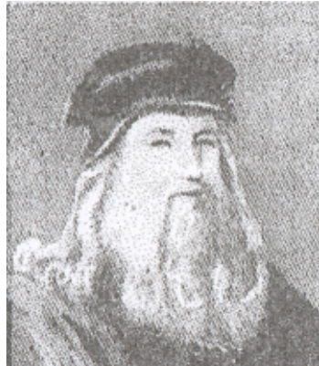
Leonardo da Vinci (1452—1519), Italiaansch schilder ("Laatste Avondmaal", "Mona Lisa", "Gioconda"), ingenieur (vliegtuig, draaiend tooneel), architect, astronoom, anatoom, wis- en scheikundi-

Het verbaasde me enige tijd terug, dat een vriend, die tamelijk wetenschappelijk is ingesteld, mij plompverloren vroeg: "Wat vind jij van de 'da Vinci code?'" Hij vertelde mij erbij dat hij het boek met veel plezier gelezen had. Ik had van hem nooit verwacht dat hij dit boek zou lezen en dan blijkbaar nog wel met zoveel interesse. Mijn reactie was: "Al die geschriften en verhalen die door de auteur worden aangehaald, waren mij niet onbekend. Alleen de verbanden die daar nu tussen worden gelegd, dat was voor mij wel nieuw en dat blijft een kwestie van speculatie. In ieder geval kan het geen kwaad om naast de bekende visies op het leven van Jezus en gebeurtenissen op een andere manier daarnaar te kijken.