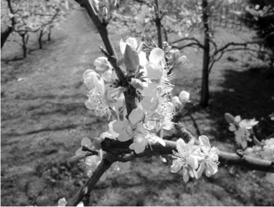
De Betuwe tijdens de Bloesemtocht 18 april