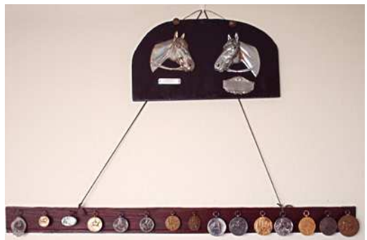
Enkele van de behaalde medailles

Ik begreep de paarden en zij mij. Ik maakte nooit fouten met ze, terwijl ik er nooit voor geleerd heb. Kijk maar eens op die foto. Die is genomen op de Zelhemsse Paardenda-