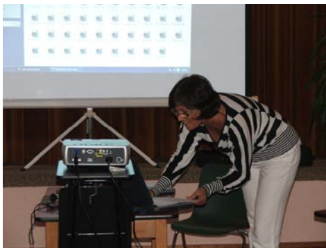
Aria in gesprek met haar computer en sorteert de digitale foto's

Het was een waardige afsluiting van het seizoen 2007-2008.