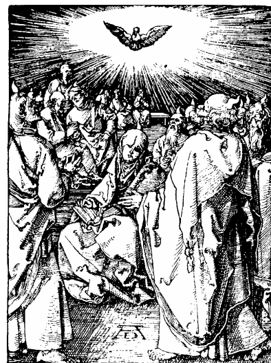
Houtsnede van Albrecht Dürer uit 1511.

Het verhaal van de “uitstorting van de Heilige Geest” (Handelingen 2) spreekt van “toegen als van vuur die zich op ieder van hen zetten”. Eeuwenlang hebben de mensen dit heel letterlijk opgevat. Je zag het ook wel in ouderwetse kinderbijbels of op zondagsschoolplaatjes: Dürer beeldt op al de gestalten een vlammetje op het hoofd af. En boven alles ziet u weer de duif als gestalte van de Geest van God. Interessant is de figuur in het midden,