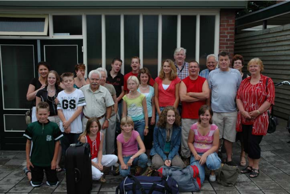
Klaar voor vertrek.