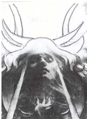
Parsifal zoals verbeeld door de 19e-eeuwse franse kunstenaar Jan Delville

Dit probleem is niet nieuw. Het is van alle tijden. In veel mythen en legenden uit het verleden vinden we dit motief dan ook terug. En wie eerlijk op beslissingen terugkijkt in zijn of haar eigen leven zal moeten erkennen ook zelf, door gebrek aan voldoende kennis van zaken, wel eens de mist in te zijn gegaan. In de legende van Parsifal vormt deze tragiek de diepere boodschap van het verhaal.