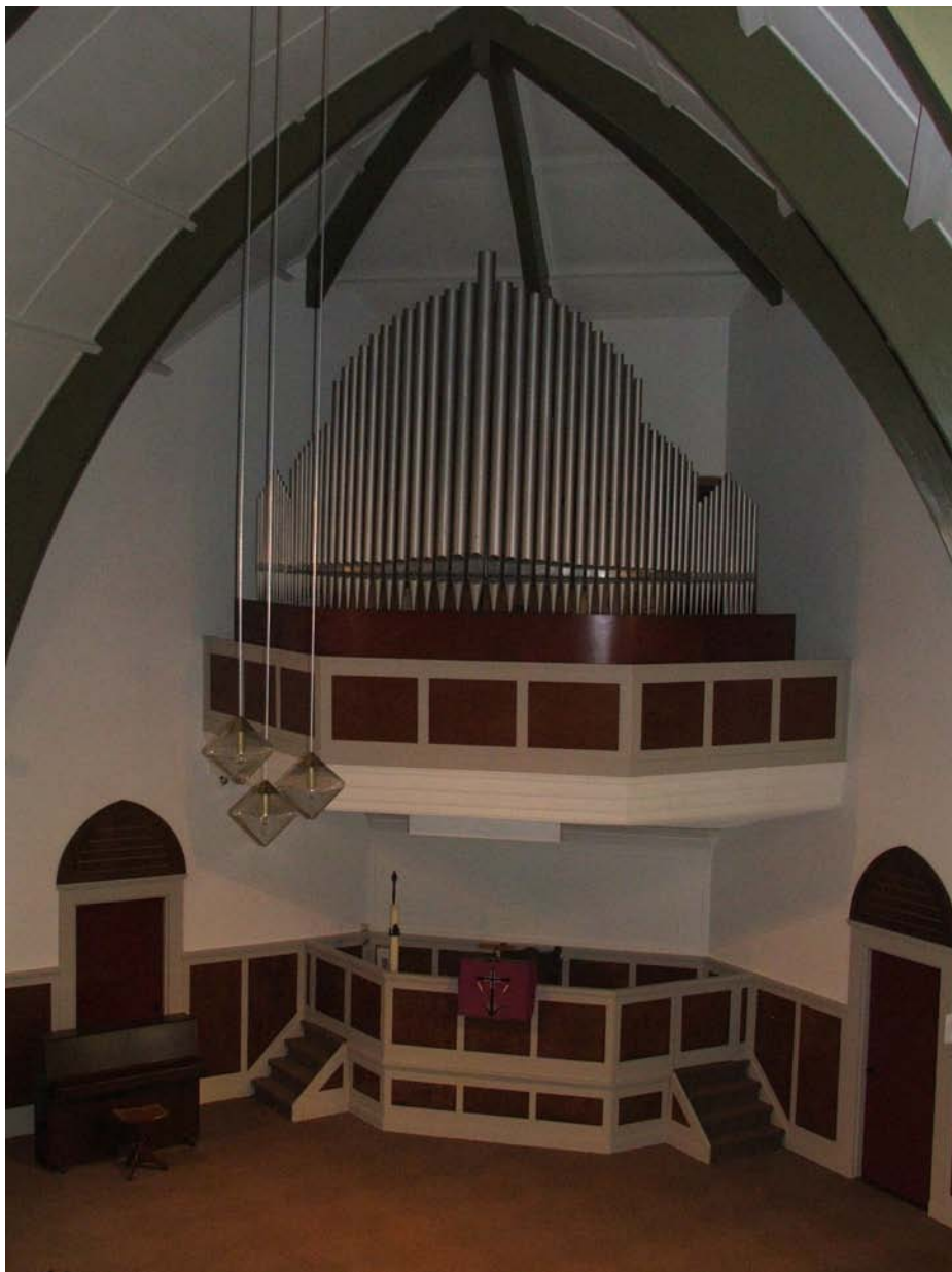
Interieurbeeld van het “Witte kerkje” orgel en kansel