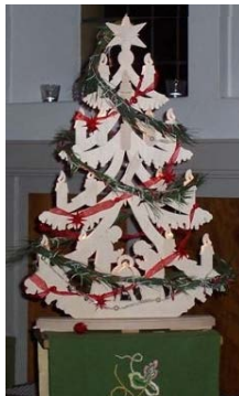
Het blankhouten verlichte kerstboompje dat tijdens de kerstdiensten de kerk opsierde. Een prachtig stukje figuurzaagwerk.